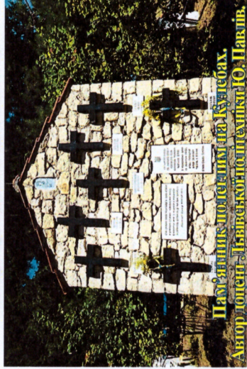
Пам'ятник полеглим на Кулебах. Автор проекту – Львівський політехнік Ю. Павлів.