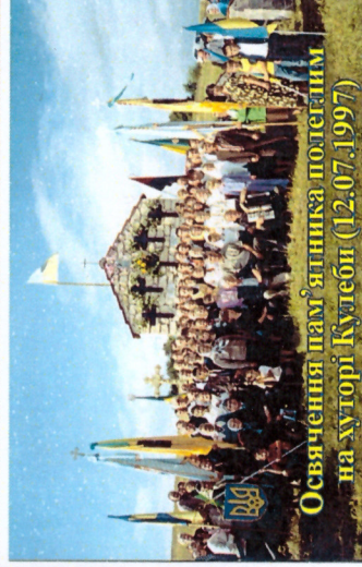
Освячення пам'ятника полеглим на хуторі Кулеби (12.07.1997)

Фестиваль, як свято-реквієм набув спершу міжобласного, а згодом – всеукраїнського статусу.