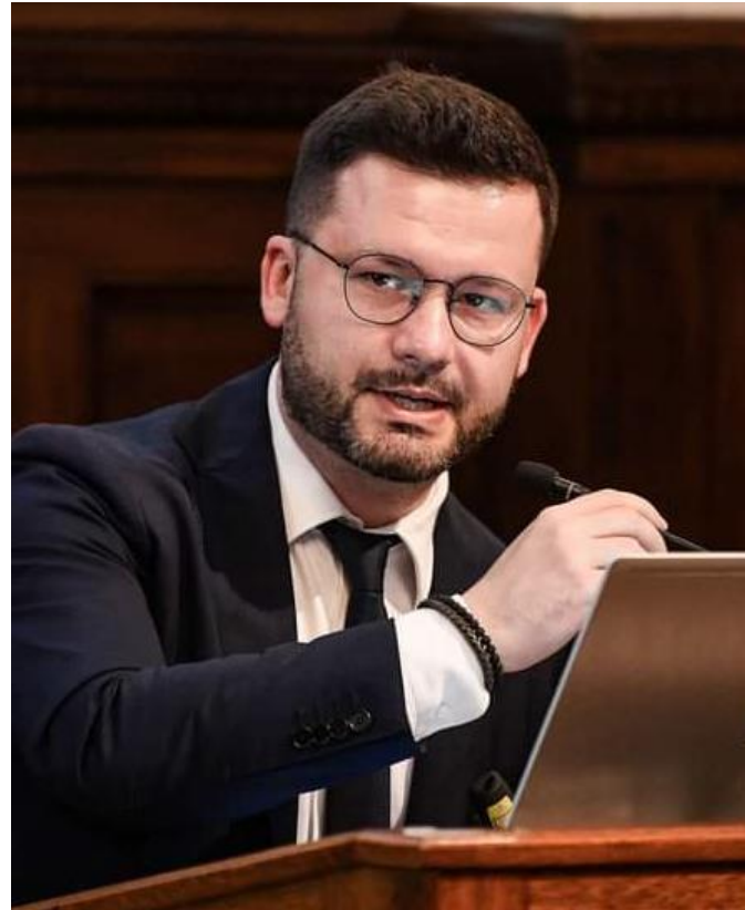
КУЗЬО ВОЛОДИМИР Міністерство економіки України заступник міністра