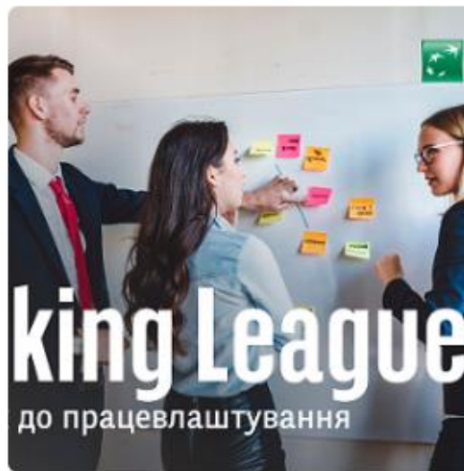
BANKING LEAGUE — ЧЕЛЕНДЖ