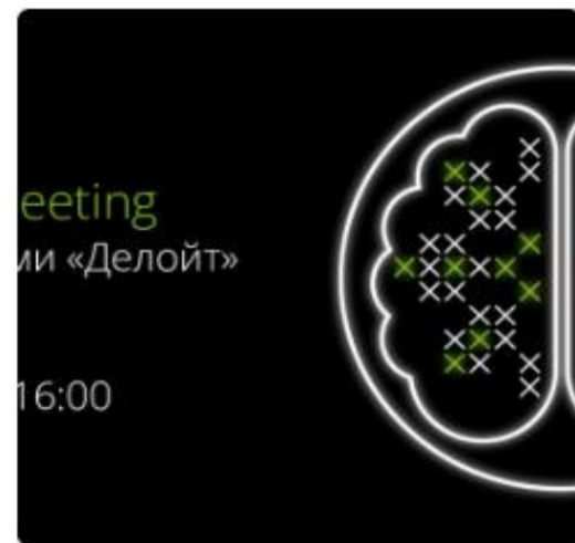
ЗАПРОШУЄМО НА ЗУСТРІЧ ЗІ СПЕЦІАЛІСТАМИ «ДЕЛОЙТ» В