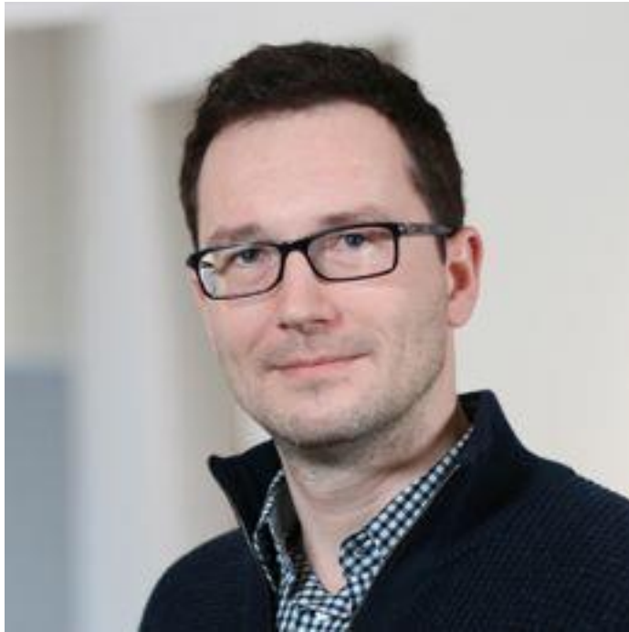
ШЕРЕМЕТА РОМАН д.е.н, професор Школи менеджменту ім. Везерхеда при Університеті Кейс Вестерн Резерв, США