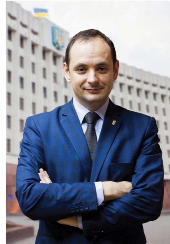
МАРЦІНКІВ РУСЛАН Міський голова Івано-Франківська