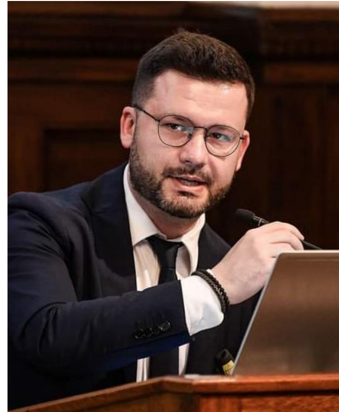
КУЗЬО ВОЛОДИМИР Міністерство економіки України заступник міністра