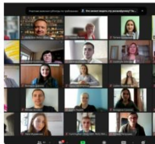
ВІТАЄМО ПЕРЕМОЖЦІВ МІЖНАРОДНОГО КОНКУРСУ