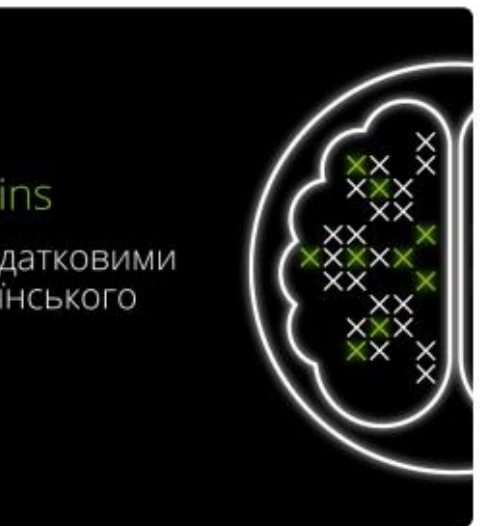
ЗАПРОШУЄМО НА ШОСТИЙ КЕЙС-ЧЕМПІОНАТ ВІД