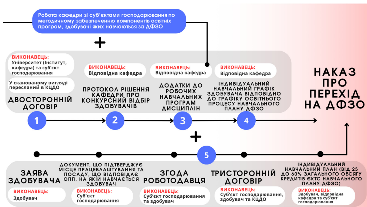
Схема реалізації переходу здобувачів освіти на ДФЗО у Івано-Франківському національному технічному університеті нафти і газу

Розробка Перезової І. (Івано-Франківський національний технічний університет нафти і газу)