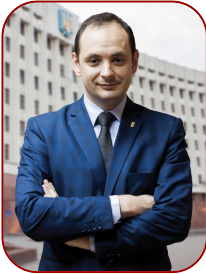
Марцінків Руслан - міський голова Івано-Франківська