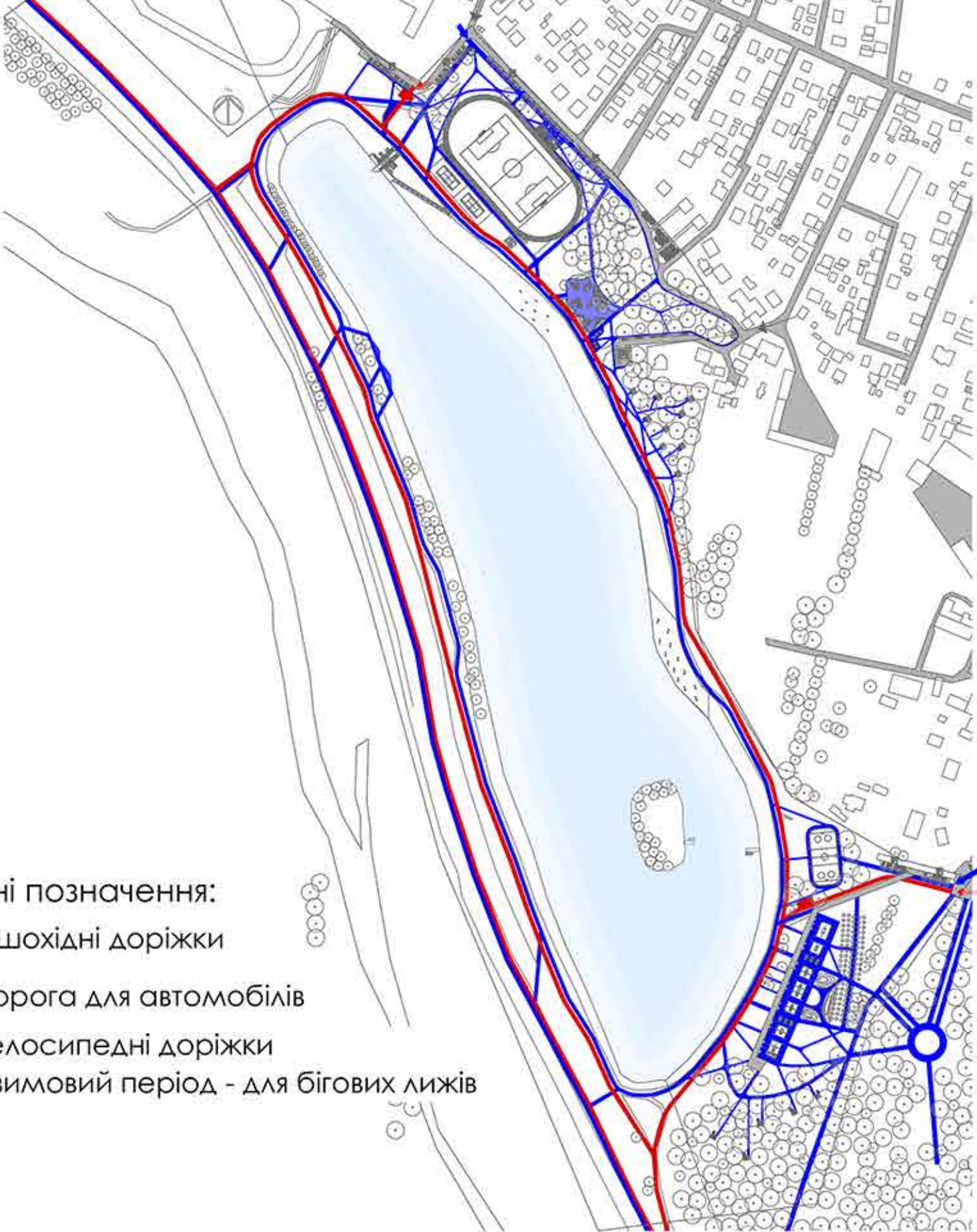
Схема руху М1:5000