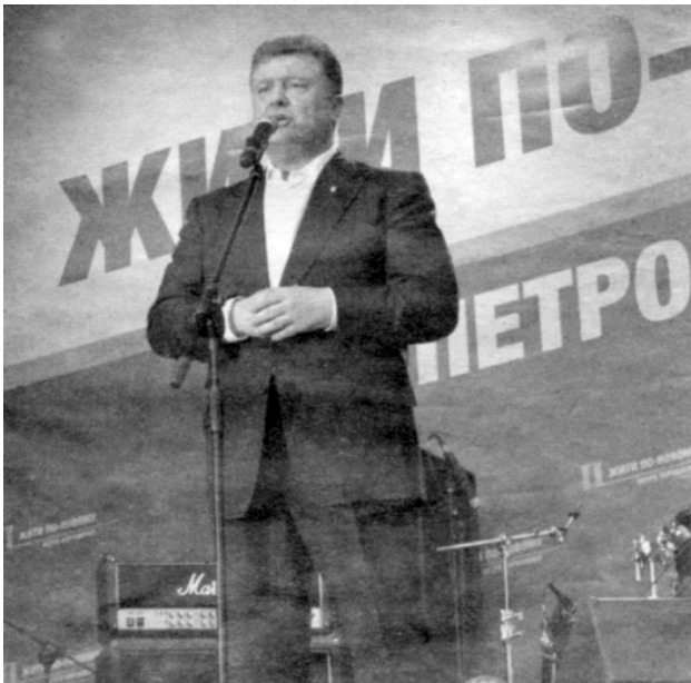
На знімку: Петро Порошенко під час зустрічі з іванофранківцями.

7 червня був знаменний день для всієї нашої держави – у Верховній Раді присягу склав п'ятий Президент України Петро Порошенко.