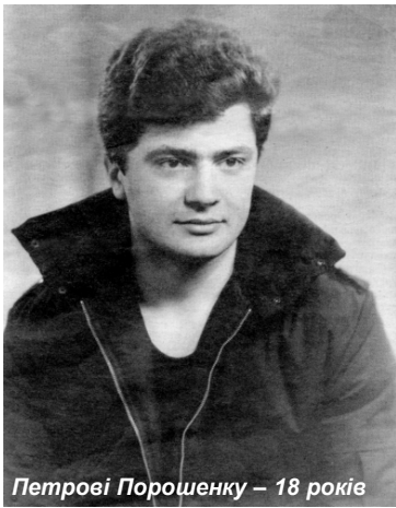
Петрові Порошенку – 18 років

У 1998 році Петро Порошенко став наймолодшим народним депутатом. Тоді на округу у Вінниці переміг з перевагою лише в 50 голосів. А у 2012 році на тому ж округу Порошенко заручився рекордною для всієї України підтримкою: його підтримало 78% виборців. Складно, мабуть, знайти більш промовисту оцінку його роботи.