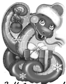
3 Новим роком!

З давніх часів вчені вивчали позитивну дію отрути окремих змій на людський організм, тому символом медицини є чаша із змією. 2013-ий буде вдалим у плані здоров'я, але лише у тих, хто за ним пильно стане стежити, оберегати себе від інфекцій.