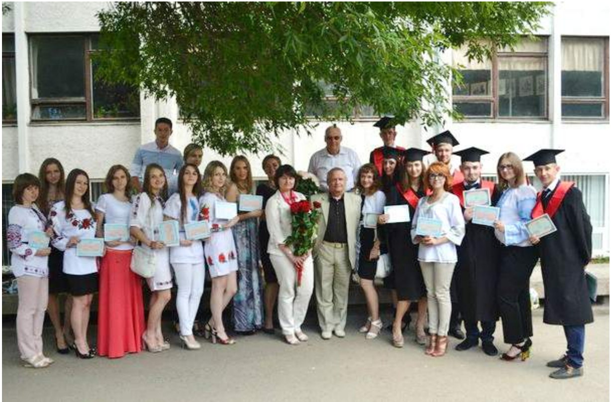
Вручення дипломів випускникам спеціальності «Менеджмент організацій і адміністрування», липень 2014 року