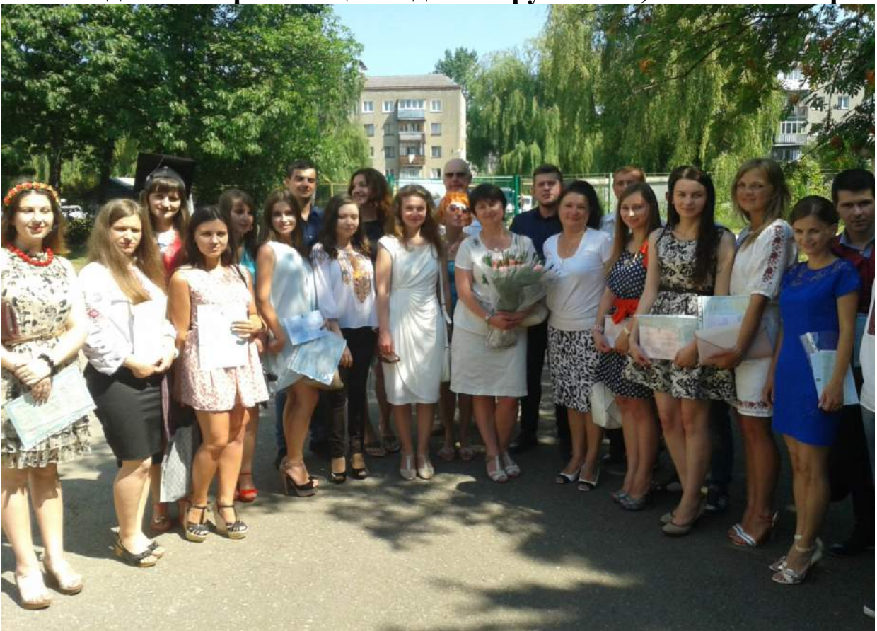
Вручення дипломів випускникам спеціальності «Менеджмент організацій і адміністрування», липень 2015 року