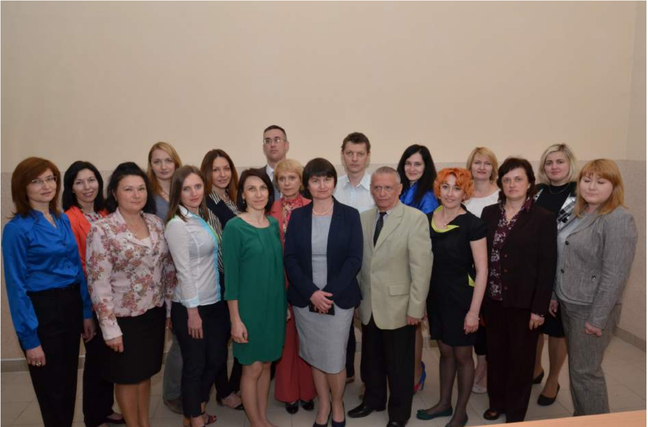
Кафедра менеджменту і адміністрування (червень 2016 року)