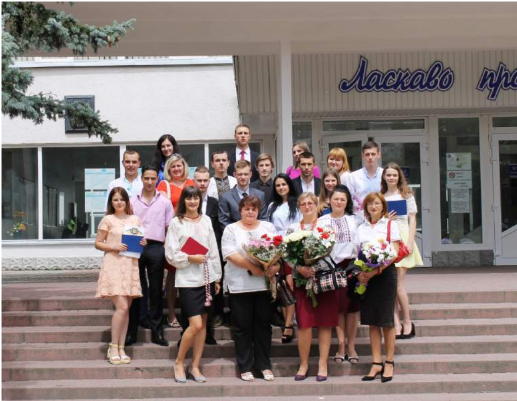
Вручення дипломів випускникам спеціальності «Менеджмент організацій і адміністрування», липень 2016 року