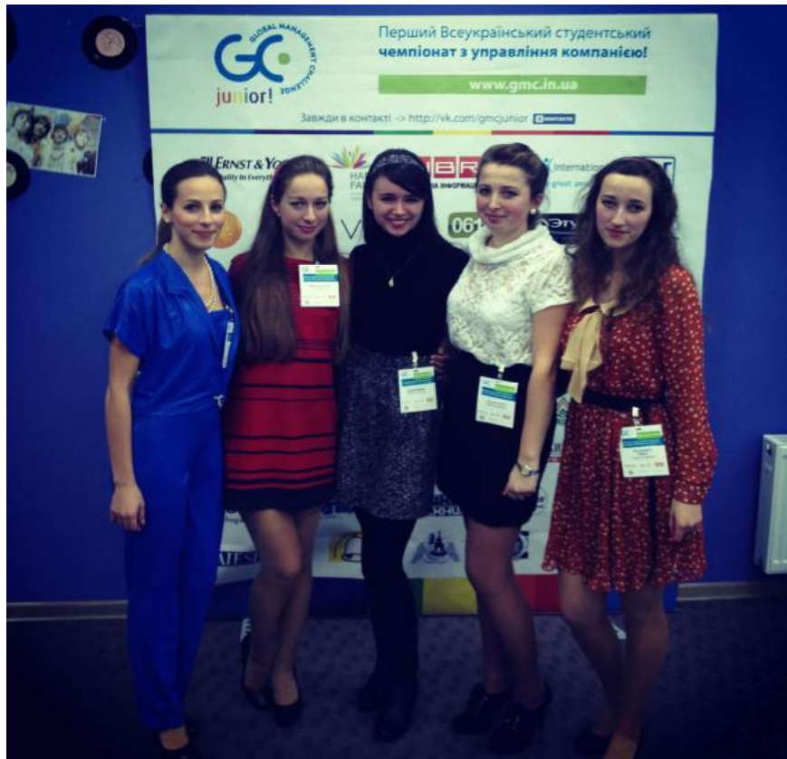
Учасники-призери (3 місце) Першого Всеукраїнського студентського чемпіонату з управління компанією, студенти гр. МО-08 (2013 рік, м. Київ)