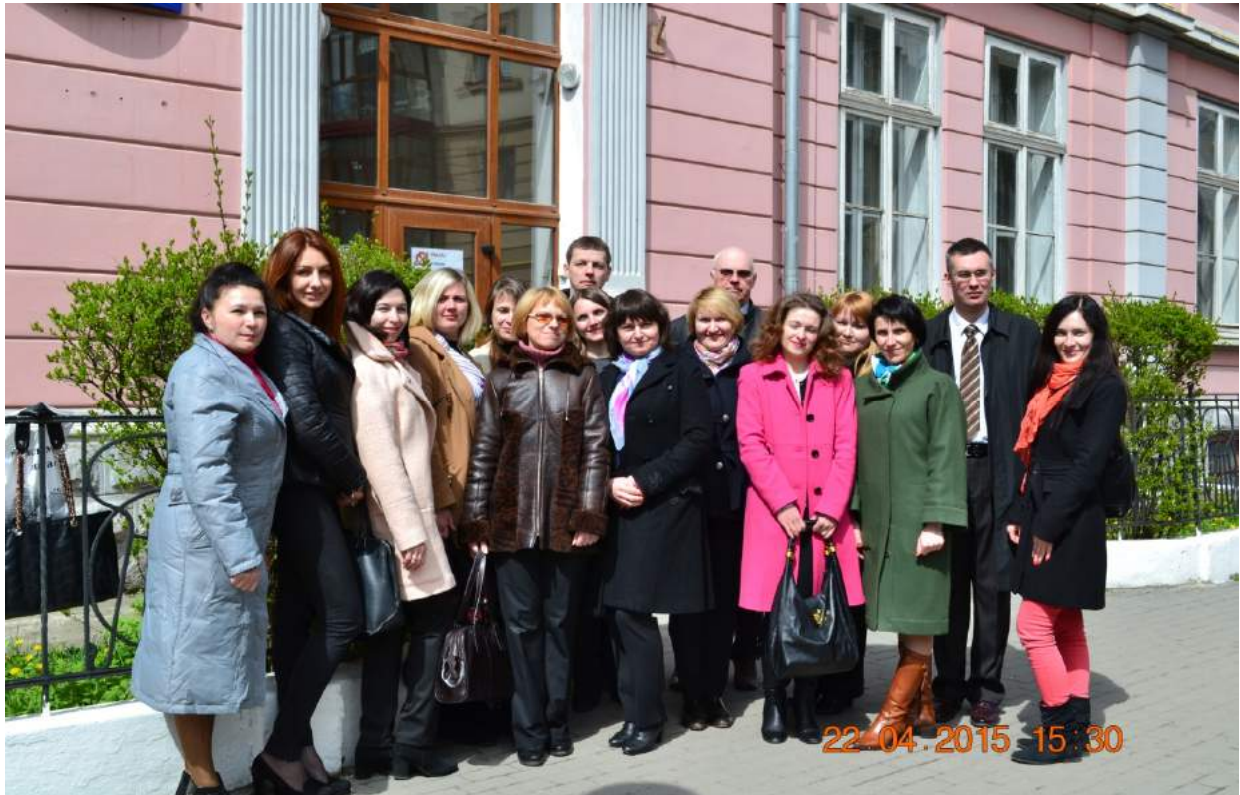
Кафедра менеджменту і адміністрування біля 4 корпусу ІФНТУНГ по вул. Шопена (весна 2015 року)