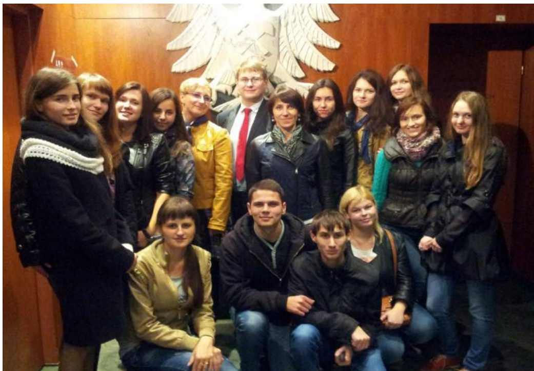
Студенти кафедри менеджменту і адміністрування та економіки підприємства ІФНТУНГ у Краківській гірничій академії ім. Станіслава Сташіце