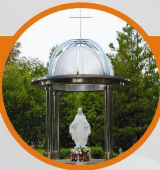
Ротонда Пречистої Діви Марії покровительки університету

вул. Карпатська, 15 м. Івано-Франківськ, 76019, Україна тел.: +380 (342) 54-72-66 факс: +380 (342) 54-71-39 E-mail: admin@nung.edu.ua Web-site: www.nung.edu.ua